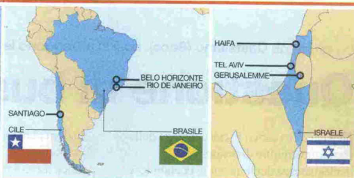
Valley Ai piedi delle Ande, la Silicon cilena. Sotto, la Silicon Wadi in Israele